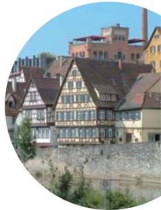
Blick vom Kocherufer zum Sudhaus

Unser Ausflug in die Kulturmétropole am Kocher beginnt am Bahnhof, hoch über der Stadt. Auf der Fußgängerbrücke überqueren wir den Hirschgraben und genießen den ersten Eindruck der Stadt. Links und rechts am Ufer des Kochers eine Fülle historischer Gebäude, die größtenteils liebevoll restauriert wurden.