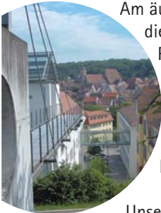
Erster Blick über Schwäbisch Hall

Am äußersten Rand des HNV-Landes liegt die Stadt Schwäbisch Hall. Die Dichterin Ricarda Huch schrieb: „Natur hat diese Stadt gewiegt – Kunst hat sie gebildet“. Die herrliche Altstadt ist bereits ein kulturelles Erlebnis und bietet den Rahmen für ein breites Spektrum kultureller Aktivitäten.