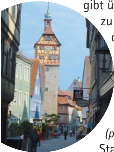
Der Josenturm in der Gelbinger Gasse

Schwäbisch Hall lädt nicht nur zum Flanieren und Bestaunen der schönen Fassaden ein, es gibt überdies 2.500 Jahre Stadtgeschichte zu entdecken. Der erste Weg führt uns deshalb zunächst zur Touristik- und Marketinggesellschaft ( öffnet von 9 bis 18 Uhr, Samstag und Sonntag 10 bis 15 Uhr ). Das Info-Center liegt unterhalb der mächtigen Kirche St. Michael. Dort decken wir uns mit einem Stadtplan ( praktisch vom Block! ) und weiteren Stadtinformationen ein.