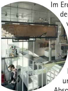
Erdgeschoss: Leben am Limes

Im Erdgeschoss wird die Lebensweise der Menschen beiderseits der Grenze vorgestellt, ein Limes teilt die Ausstellung in einen römischen und einen germanischen Teil. Bei den Römern stehen die Bereiche des Kastellortes im Vordergrund: Das Kastell, das Lagerdorf, das Gräberfeld und der Limes werden in einzelnen Abschnitten erläutert. Herausragend sind die berühmten Holzfunde aus dem Beneficiarier-Weihebezirk und die Fragmente der gewaltigen Grabdenkmäler aus Osterburken. Die germanischen Nachbarn werden anhand neuer Funde aus dem Taubertal erstmals in einem Museum am Limes präsentiert.