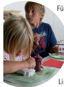
Kinder gießen Altarsteine

Im Altbau ist das 1976 ausgegrabene Badegebäude konserviert, die Ausstellung widmet sich hier dem Badewesen der Römer. Hinter dem Bad ist der Beneficiarier-Weihebezirk nach den Originalfunden nachgebaut: Der aus Holz errichtete Tempel und die in Reihen aufgestellten Weihesteine geben einen Eindruck, wie der Tempelbezirk damals aussah.