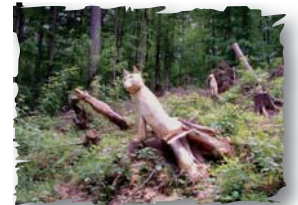
Kunstwerk am „Koppenbrünnele“

An der großen Weggabelung halten wir uns links ( + ) und erreichen nach wenigen Metern das "Koppenbrünnele". Am Brunnen über die kleine hölzerne Brücke und den schmalen Trampelpfad links bergauf. Über eine weitere Brücke geht's auf den Waldweg zurück. Auf diesem weiter bergan. Wir folgen dem roten Punkt bis zu der Kreuzung, an der der markierte Weg nach rechts abbiegt. Hier verlassen wir die Markierung für eine Weile und halten uns weiter geradeaus. An der nächsten Kreuzung nun rechts. Nach ca. 350 m weist uns wieder die bekannte Markierung () den Weg. Am Waldrand erreichen wir die Lutz-Sigel-Hütte (Waldspielplatz und Grillstellen). Wir verlassen den Wald und folgen der Straße geradeaus zur Burg Stettenfels. Greifvogelwarte und Biergarten laden zum Verweilen ein ( www.burg-stettenfels.de ).