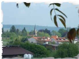
Blick auf Lehrensteinsfeld

Ausgangspunkt ist die „Wehrturm“ in Lehrensteinsfeld. Von dort vorbei am Rathaus die Schlosstraße hinauf bis zur Weingärtnergenossenschaft (WG). Nach der WG links in die Trollingerstraße. Ab hier ist der Weg mit blauem Punkt und roter Traube markiert. Nach 15 m rechts ab und die nächste Möglichkeit wieder links den Berg hinunter. Unten biegen wir rechts in den Feldweg ab und folgen diesem ca. 500 m geradeaus direkt zum großen Walnussbaum.