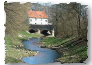
Brücke über die Elz

Besichtigung der heutigen katholischen Pfarrkirche Mariä Himmelfahrt lohnt allemal. Nach dem Tempelhaus geht es rechts weiter, wo wir nach ca. 200 m zum ersten Mal die Elz überqueren.