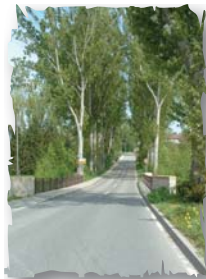
Straße nach Bürg

Neuenstadt – Kochertürn erreichen. Wir folgen dem Fußweg rechts bis nach Kochertürn.