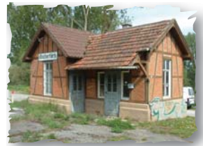
Alter Kochertürner Bahnhof

Wer bereits in Degmarn die Tour beenden will, findet im Waldhang einen Treppenaufstieg, der direkt nach Degmarn führt.