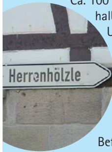
Wegweiser in Unterheimbach

Ca. 100 m nach der Brücke geht es halblinks hoch über den Schlaitig nach Unterheimbach. Dort wandern wir zunächst ein kurzes Stück auf der Hauptstraße Richtung Oberheimbach, biegen dann nach dem Gasthof „Traube“ rechts ab und beginnen den Anstieg zum Herrenhölzle.