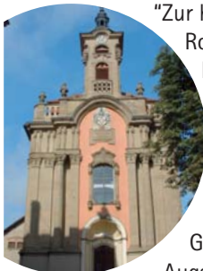
Rokokokirche in Meßbach