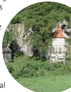
St. Wendel zum Stein

Wir wandern weiter, jetzt auf dem Wanderweg 16, vorbei am Naturdenkmal Linde auf der „Alten Poststeige“ zur Wallfahrtskapelle „St. Wendel zum Stein“. Erbaut