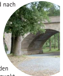
Jagstbrücke in Hohebach

Weiter geht es durch den Kapellenwald nach Hohebach zur Jagstbrücke und auf der anderen Seite der Jagst zum jüdischen Friedhof. Dieser wurde 1852 angelegt und ist bis heute Zeugnis jüdischer Mitbürger, die bis 1942 hier lebten. Nun geht es auf dem asphaltierten Weg, parallel zur B 19 und dem schwarzen Felsen am gegenüberliegenden Jagstufer zurück zu unserem Ausgangspunkt nach Dörzbach.