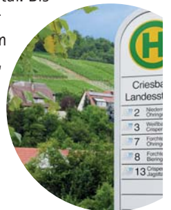
Haltestelle Criesbach, Landesstraße

Am Criesbacher Sattel angelangt, überqueren wir die Kreisstraße und folgen dem „Georg-Fahrback-Weg“ hinunter nach Criesbach. An der Haltestelle „Landesstraße“ endet unsere Tour.