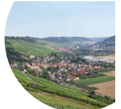
Panorama-Blick bis Criesbach

wir die asphaltierte Straße bergab und genießen den herrlichen Panorama-Blick auf Weißbach und den Kocher. Der Weg führt uns durch den Ort, über die Niedernhaller Straße und die kurze Weinbergsteige wieder in die Weinberge.