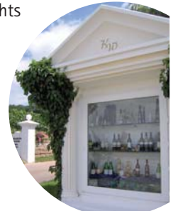
Am Weingut Kurz-Wagner

weiteren rund 25 m halten wir uns rechts und überqueren die Straße. Nach ca. 500 m biegen wir nach links ab. Im Zickzack-Kurs geht es nun weiter durch die Weinberge immer in Richtung Weingut und Wald. Um unser Zwischenziel – den Haigern – zu erreichen, haben wir nun zwei Möglichkeiten: