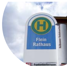
Haltestelle Flein, Rathaus

Von hier gehen wir in die Erlachstraße und folgen dieser rund 800 m bis zu einer Gabelung. Hier nach rechts.