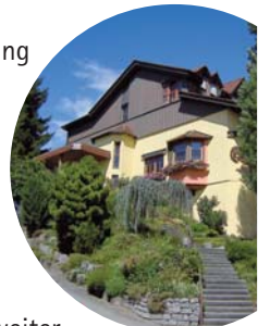
Wo der Hahn kräht

und erreichen den bekannten Landgasthof „Wo der Hahn kräht“ - eine gute Gelegenheit für eine kleine oder auch größere Pause.