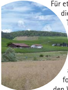
Im Fleiner Tal

Für etwa 2 km folgen wir nun diesem Feldweg ins Fleiner Tal. Bevor wir den Wald erreichen, nutzen wir die letzte Möglichkeit und biegen nach links ab. Diesem Weg folgen wir immer weiter. Nach einer Linkskurve kommen wir an Schrebergärten vorbei. An der folgenden Weggabelung schlagen wir den Weg nach rechts ein. Diesem folgen wir bis zur nächsten Gabelung. Hier nun nach links.