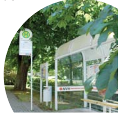
Kocherstetten, Haltestelle Ort

Über diese gelangen wir nach Kocherstetten. Mitten durch den Ort fließt der Erlesbach, der ebenfalls in den Kocher mündet. Hier an der Haltestelle „Ort“ endet unsere Tour. Wer möchte, kann natürlich noch einen Abstecher hinauf zum Schloss unternehmen.