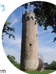
Aussichtsturm auf dem Wartberg

Wir gehen durch die Unterführung und biegen anschließend nach links in die Allee. Nun, vorbei am Landratsamt, weiter in die Stettenstraße und nach dem Friedhof rechts in die Straße „Am Künsbach“. Am Abzweig zur Rösleinsbergstraße biegen wir ab in die Leimengrube. Von hier geht es in Serpentinaufwärts, hinauf auf den 372,5 m hohen Wartberg. Leider ist der Aussichtsturm meist verschlossen.