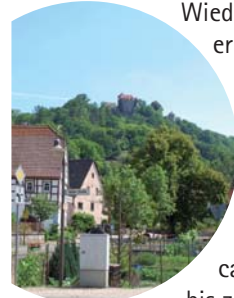
Blick zum Schloss Stetten

Wieder auf Asphalt erhalten wir bald eine schöne Aussicht über den Ort Kocherstetten und das darüber thronende Schloss Stetten. Im Kochertal angekommen führt uns der Weg noch ca. 100 m auf der Kreisstraße entlang bis zur Kocherbrücke.