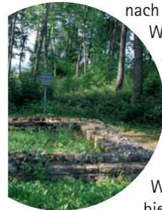
Reste eines römischen Wachturms

Wir überqueren einen Bach, gehen die Hauptstraße weiter aufwärts und halten uns an der Gabelung am Ortsrand links Richtung Dörnishof. Es handelt sich bei dieser engen Waldstraße um einen offiziellen Verkehrsweg. Wir achten nun auf einen Waldweg, der uns mit der Markierung „Östlicher Limesweg“ nach rechts führt. Wieder geht es rechts auf einen Asphaltweg und gleich darauf tauchen wir wieder in den Wald ein. Wir erreichen ein Bachbett, überqueren es und gehen anschließend rechts am Ackerrand entlang. Wir biegen im spitzen Winkel