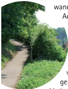
Aus Adelshheim hinaus

und nach einigen Metern links am Waldrand weiter. An der größeren Wegkreuzung halten wir uns links, wandern in den Wald hinein und wenden uns an der Abzweigung im spitzen Winkel nach links. Es geht an der Schutzhütte auf dem Eckenberg vorbei und weiter auf dem Forstweg entlang. Wir passieren eine Schranke und wandern geradeaus den Asphaltweg abwärts nach Adelshheim. Hier geht es links die Straße abwärts. In einer Rechtskurve weist uns das gelbe Andreaskreuz den Weg nach links die Weimarer Treppe hinunter. Wir überqueren die Bundesstraße, gehen die Stufen hinab und folgen dem asphaltierten Weg über die Kirnach. Wir biegen rechts ab und