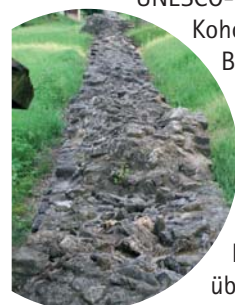
Mauerreste des Römerkastells

Wir folgen weiter der Straße und biegen am Ende des Waldes nach links ab. Es geht am Pferdehof vorbei und an der Kreuzung geradeaus auf die Straße nach Osterburken. Wir wenden uns links in die Wemmershöfer Straße und kurz darauf rechts zum Römerkastell. Das ehemalige römische Kastell Osterburken liegt am Obergermanisch-raetischen Limes, der 2005 zum UNESCO-Weltkulturerbe erhoben wurde. Das