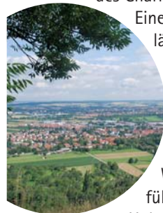
Blick auf Öhringen und Umgebung

Eine alleinstehende Bank lädt ein, die grandiose Aussicht über Pfedelbach, Öhringen, und, und, und, eine zeitlang zu genießen. Der Grasweg führt uns wieder vor den Hof. Dort halten wir uns links und kommen zu einem Wegweiser, der uns nach Pfedelbach führt - wiederum durch typische Hohenloher Streuobstwiesen. In Pfedelbach (Haltestelle Schloß) endet unsere Tour.