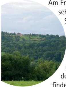
Blick auf Heuberg

Am Friedhof vorbei geht es schnurstracks aufwärts durch herrliche Streuobstwiesen und Beerenhecken. Ab und an geben die Obstbäume und Sträucher den Blick auf Heuberg frei. Wir erreichen den Wald und folgen dem Waldweg weiter hinauf bis nach Buchhorn. Gleich zu Beginn der Ortschaft - nahe der Sägemühle - finden wir links den Klingenbrunnen. Eine kleine Steintreppe führt uns hinab zu dieser märchenhaften Stelle. Jetzt haben wir die Wahl. Entweder drehen wir noch eine Runde um den See (Winter-Tipp):