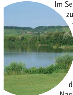
Auf dem Damm am Südwestende

Im See sind nun mehrere Inseln aus Stein zu sehen, die als ungestörte Laichplätze für Fische künstlich aufgeschüttet wurden. Eine weitere Balkensperre schützt die Tiere und Pflanzen vor menschlichen Wassersportlern. Von den Anglerstegen an dieser Seeseite kann man einen herrlichen Blick über die Wasserfläche genießen.