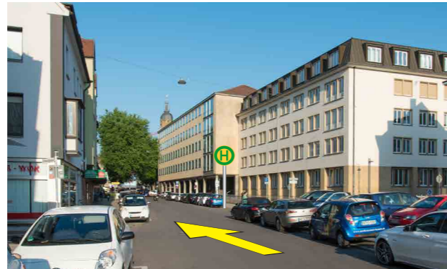
Hinter dem Rathaus – in der Lothorstraße – wird eine Ersatzhaltestelle während der Sperrung der Kaiserstraße eingerichtet.