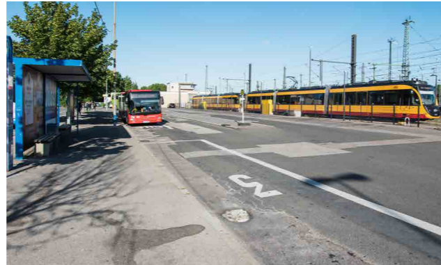
Der zentrale Omnibusbahnhof (ZOB) beim Hauptbahnhof.

Bitte beachten Sie, dass durch die längere Fahrzeit Anschlüsse eventuell nicht gehalten werden können!