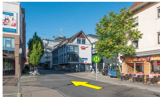
Ebenso in der Gerberstraße: Auch hier befindet sich temporär die Haltestelle Rathaus in der Gegenrichtung.