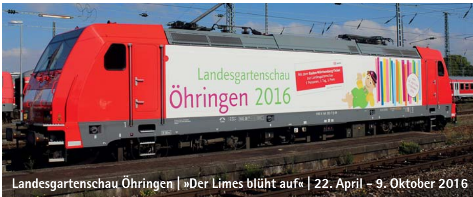
Landesgartenschau Öhringen | »Der Limes blüht auf« | 22. April – 9. Oktober 2016