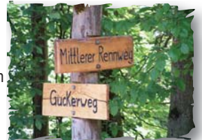
Abzweig Mittlerer Rennweg

Hier biegen wir dann rechts in den Guckerweg ab. Dieser führt uns direkt zum Mittleren Rennweg. Hier links . Auf dem Mittleren Rennweg wandern wir bis zum Waldparkplatz. Dort überqueren wir die L 1110 und gehen entlang dem asphaltierten Natoweg weiter bis zum Wertholzplatz. Dort geht es links ab Richtung Burgruine Blankenhorn (Möglichkeit zur Besichtigung).