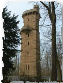
Auf dem Schweinsberg

Wir folgen dem Köpferbach und erreichen nach kurzer Zeit den kleinen Köpferstausee, den wir (links oder rechts) umgehen. Die Markierung „roter Punkt“ weist uns nun den Weg. Nach ca. 2 km gelangen wir zum Köpferbrunnele.