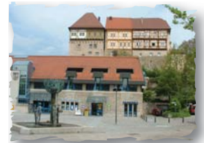
Rathausplatz in Talheim

Schließlich erreichen wir den Ort Talheim. Dort angekommen, führt uns die Schozach bis in die Bahnhofstraße, wo unsere Tour an der „Rathausplatz“ wieder endet.