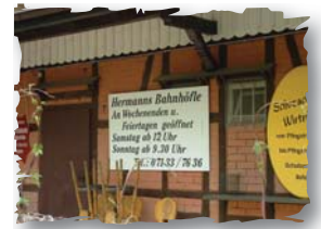
Gasthaus im Bahnhof

An Wochenenden und Feiertagen lädt das Gasthaus im alten Schozacher Bahnhof die Wanderer zur Einkehr.